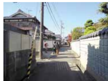
⑤尼崎登録文化財 島中家住宅