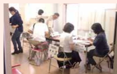
10月7日 塚口支部(みんなの尼崎大学)