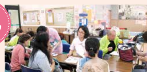
9月19日 西園田支部(コープ近松店)