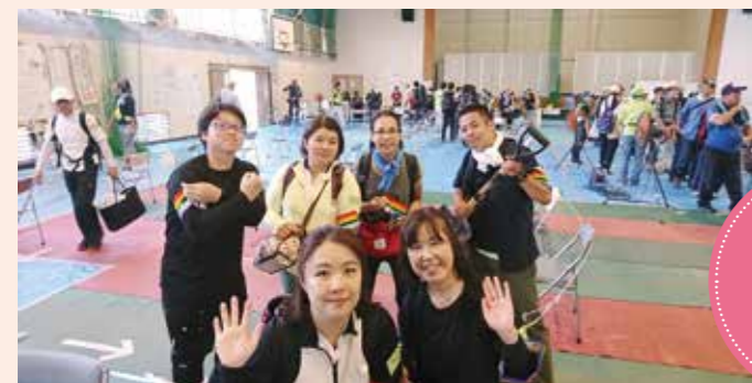
支援活動に参加した職員「がんばってきます」