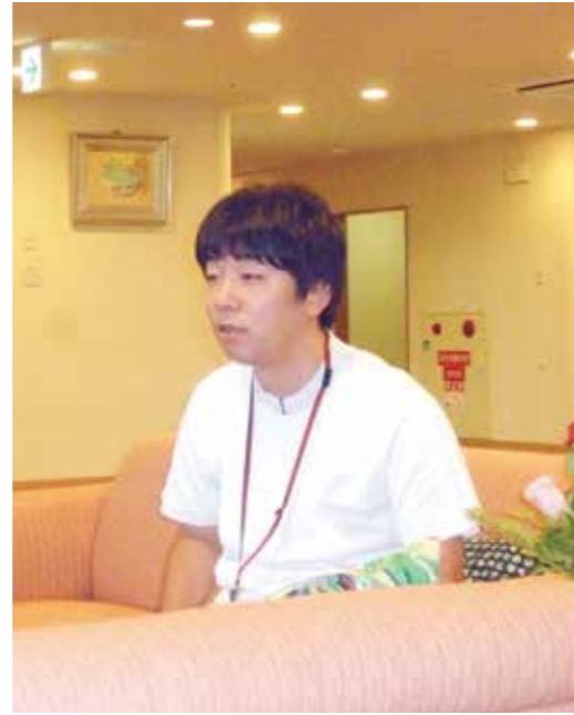
尼崎医療生協病院 2階東病棟 看護師長