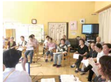
8月16日 潮江ブロック 人工膝関節学習会(潮江おひさまルーム)