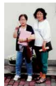
9月15日 下坂部支部 訪問行動