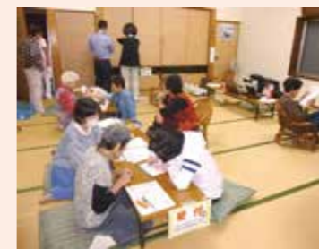
10月11日 長洲支部(愛郷会館)