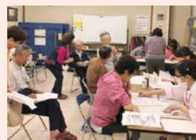
10月4日 富松支部(東富松会館)