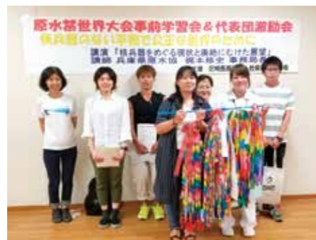
7月31日 原水禁世界大会in広島代表団激励会 (組合員ひろば)