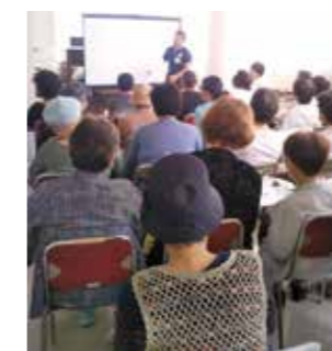
9月21日 南武西支部 人工膝関節学習会 (在宅センターから里)