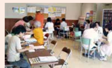
9月22日 武庫之荘支部(コープ武庫之荘店)