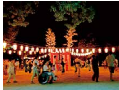
8月19日 中之島盆おどり(中之島公園)