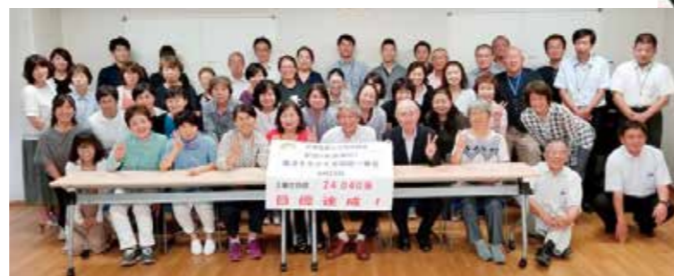
8月26日 安倍9条改憲NO!3000万署名追加目標達成(一日理事会にて)