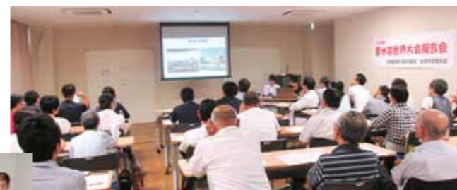
8月30日 原水禁世界大会報告会 (組合員ひろば)