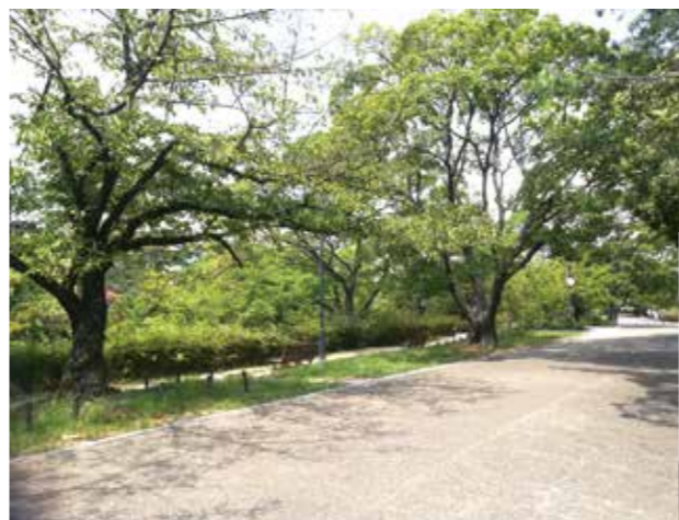
夙川オアシスロードを香櫨園駅に向かって歩きました。春は桜が満開です。