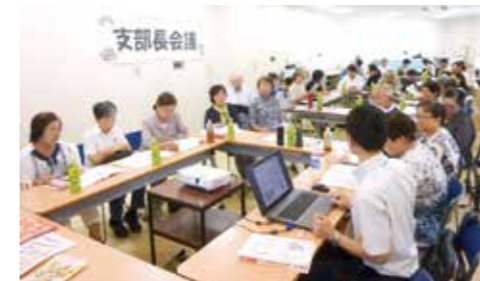
8月22日 支部長会議(ペインクリニック跡)