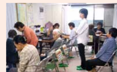
9月29日 稲葉支部(稲葉荘会館)