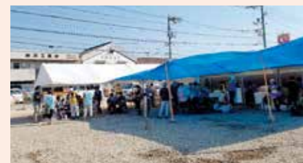
ボランティアセンター

7月15日 熱中症も心配される中、6名で岡山県倉敷市真備地区へ支援に行ってきました