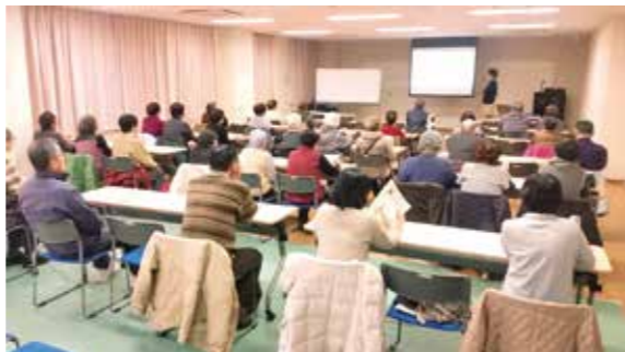
1月31日 「悪徳商法による消費者トラブル防止」学習会