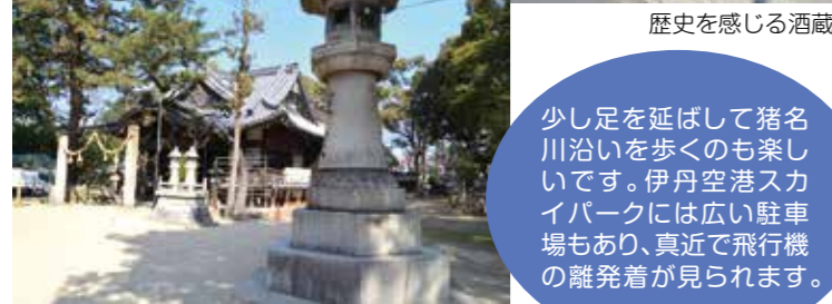
伊丹城とも呼ばれる有岡城跡