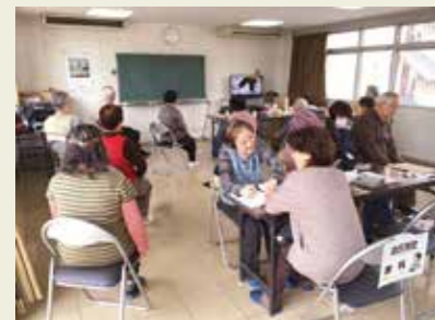
3月18日 南武庫支部 (尼崎下の森住宅集会所)