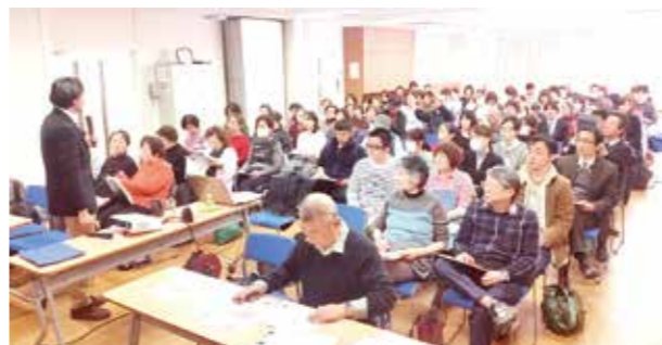
3月4日 9条の会と学習推進委員会共催の憲法学習会 現行の日本国憲法と自民党憲法草案の違いを学ぶ