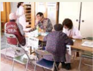
3月22日 長洲支部 (潮江市営団地集会所)