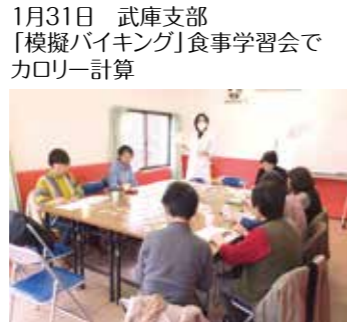
1月31日 武庫支部 「模擬バイキング」食事学習会で カロリー計算