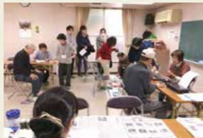
1月28日 武庫之荘支部 (武庫之荘北会館)