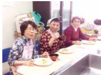
2月6日 水堂立花支部スマイル クッキング班 メニューはちらし寿司と汁ものと コーヒーゼリー