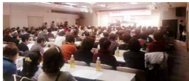
2月19日 新春潮江わくわくフェスタ(ハーティ21)