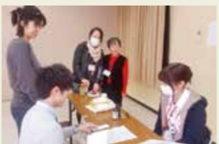
1月28日 西昆陽支部 (西昆陽南会館)