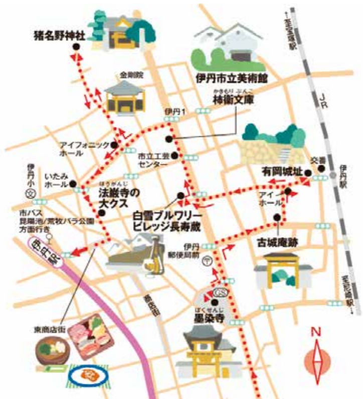
地図上の矢印は今回のコースとは関係ありません