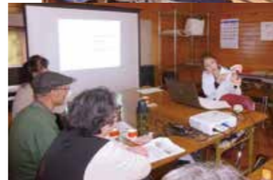
3月17日 大庄北支部葵班学習会 「8020」(80歳になっても20本の歯を 残そう)について学習