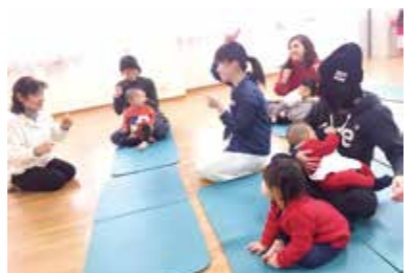
2月10日 子育てサークルいちご 元保育士から手遊びを学ぶ