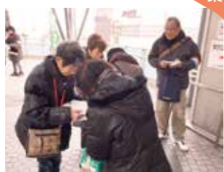
2月14日 バレンタイン署名行動 (JR尼崎駅前)