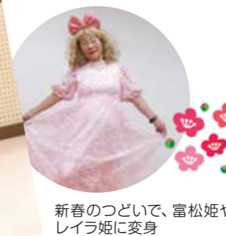
新春のつどいで、富松姫やレイラ姫に変身

を対象にした訪問行動にしました。2016年度に尼崎医療生協の班に登録したんです。