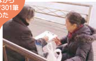
2月14日 バレンタイン署名行動 (阪急塚口駅前)