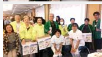
第1回尼崎市適塩化フォーラムの様子