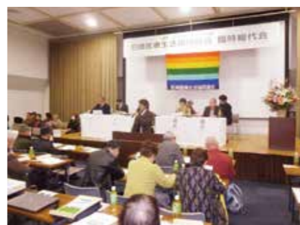
2月25日 臨時総代会(中小企業センター)

2017年1月中旬～ 3月中旬のひとこまで。 ●組合員活動部まで写真と メッセージを送ってください。 ☎06-4962-4920