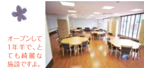
オープンして1年半で、とても綺麗な施設ですよ。