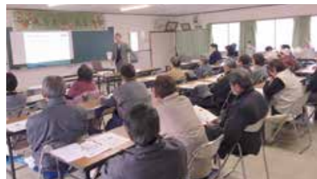
1月22日 常光寺支部大交流会 班活動紹介と新総合事業について学習