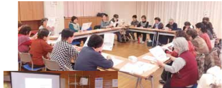
3月16日 健康づくり委員会認知 症予防チーム学習会 認知症予防の学習と健康づくり活 動交流集会の報告