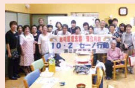
10月2日 潮江ブロック 潮江診療所と組合員で地域訪問