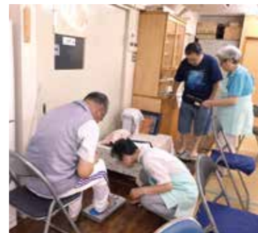
8月28日 常光寺支部健康チェック