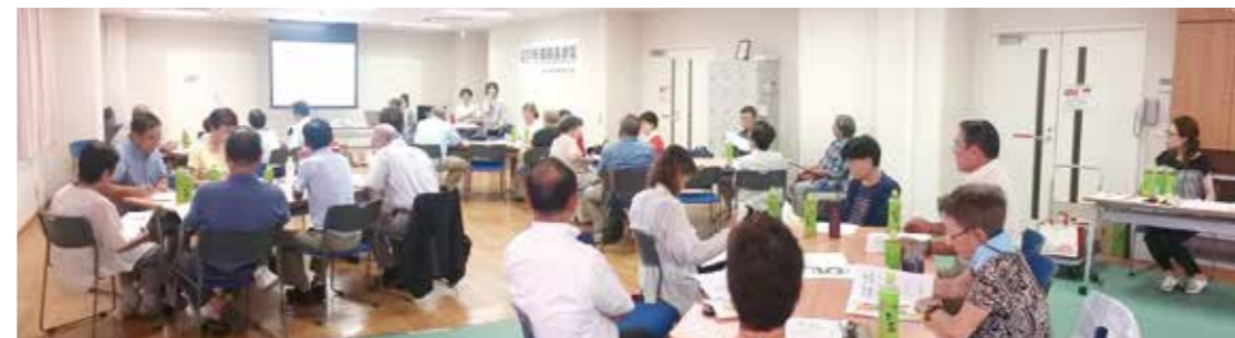
8月24日 支部長会議で「神戸医療生協長田北部支部の支部活動」学習会と「生協強化月間に向けて」の話し合い