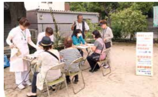
9月21日 長洲支部健康チェック