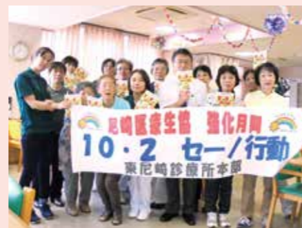
10月2日 東尼崎ブロック 東尼崎診療所と組合員で健康チェック

10月2日セーノ行動当日の加入件数は321件!! 暑い中、みんなでがんばりました! 9月20日～10月2日の生協強化月間スタートダッシュで465件まで到達しました。