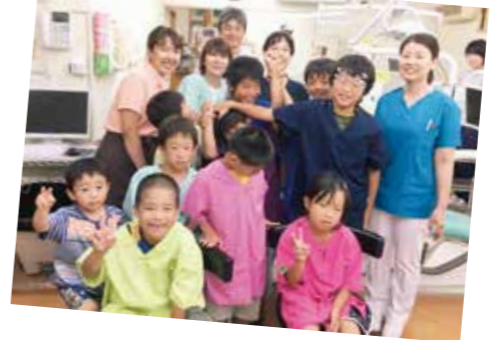
子どもたちと記念撮影(戸ノ内歯科)