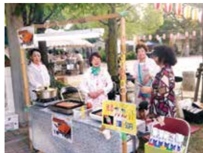
8月20日 中の島盆踊り