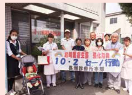
10月2日 長洲ブロック 長洲診療所と組合員で地域訪問