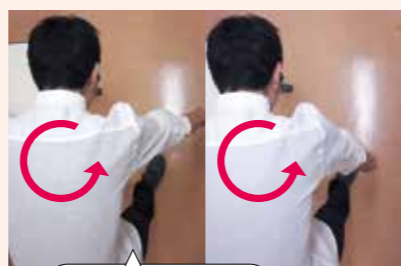
手がグルグル回る

手や肩を動かすのではなく、身体をゆすることで、振り子のように腕が動く、ということです。