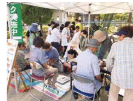
9月10日 いこいこ水堂祭り