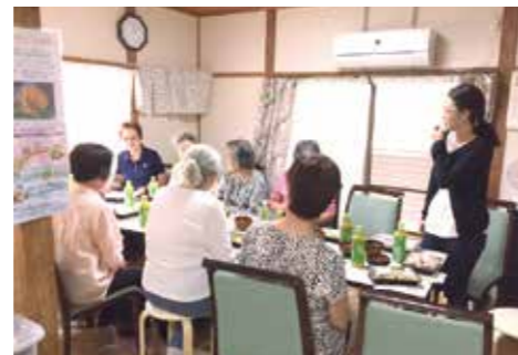
9月21日 西宮ご近所さん交流会