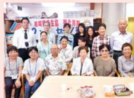
10月2日 本田ブロック 本田診療所と組合員で地域訪問