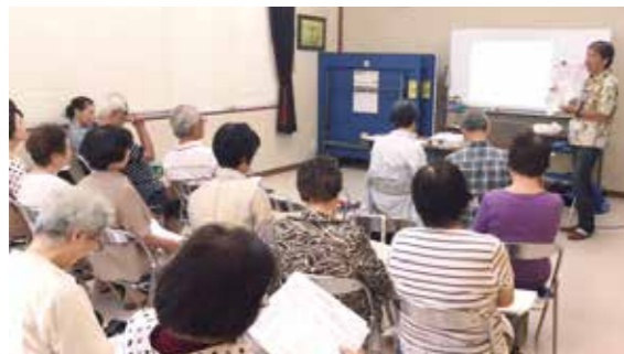
9月17日 富松支部 認知症サポーター養成講座