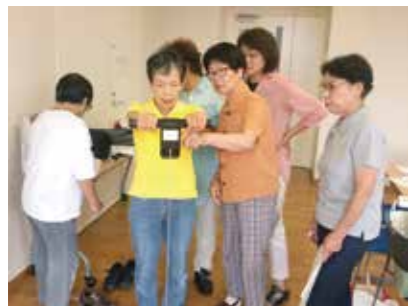
8月18日 健康づくり委員会ロコモチーム学習会