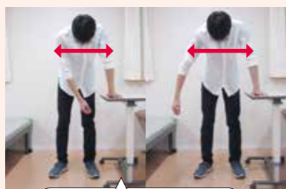
手が左右にブラブラする