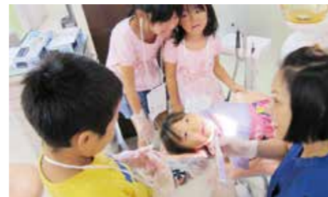
先生役になって虫歯を治療したよ(生協歯科)