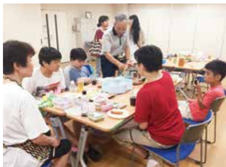
8月25日 子ども応援ひろば そうめん大会