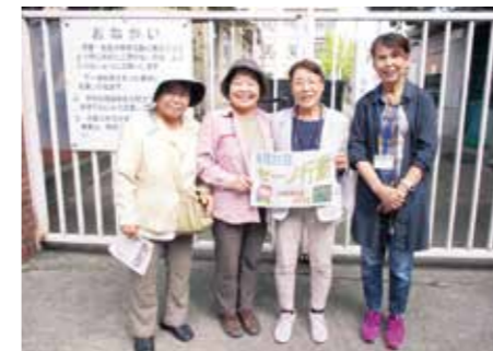
9月25日 武庫支部訪問行動