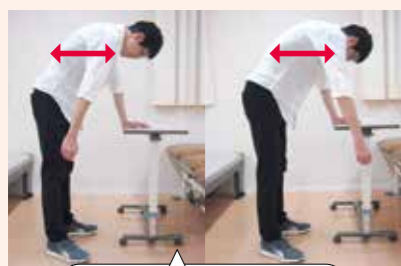
手が前後にブラブラする