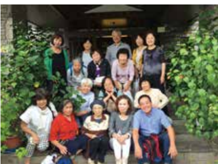
9月29日 南武庫支部バスツアーで新たなば荘