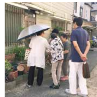
8月31日 長洲支部訪問行動

2016年8月末～10月初旬のひとこまです。 ●組合員活動部まで写真とメッセージを送ってください。 ☎06-6942-4920