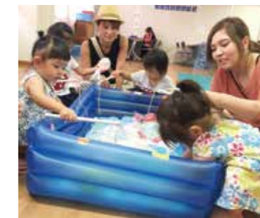
8月22日 子育てサークルいちご・スマイル合同夏まつり