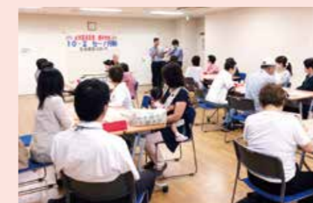
10月2日 病院ブロック 生協病院と組合員で地域訪問