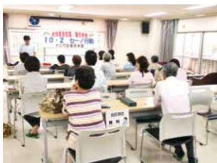
9月27日 ナニワブロック訪問行動と健康チェック