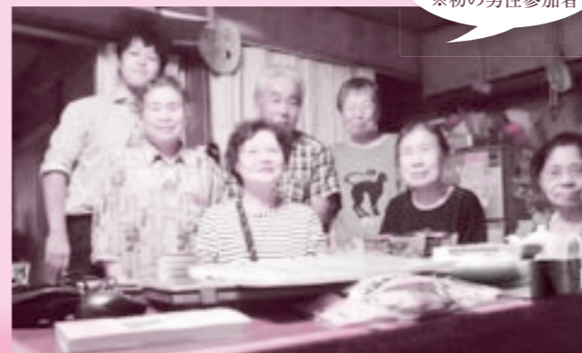
9月26日 大物茶話会 ※初の男性参加者