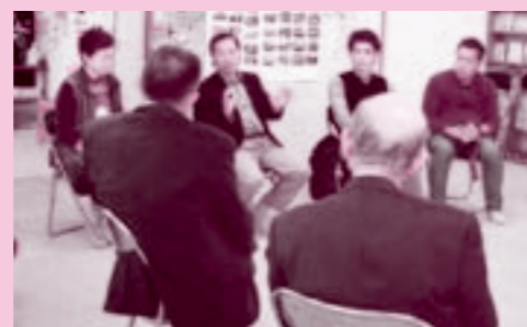
仮設住宅での懇談

との昼食をはさんだ懇談を実施。診療後に駆けつけてくださった理事長、院長先生からは「これは核害で、公害が起きる社会構造と同じもの。核害への対応は『いのちの章典』の実践で、今回の事故対応の基本となっている」とあいさつも。懇談では「事故後パニックになった」「後になってわかったのだが、放射能濃度が高かった時に子どもに水汲みで外へ出していたことを後悔している」など当時の話も。午後には川内村からの避難者の仮設住宅を訪問し、仮設住民との懇談をしました。「4～5回も避難所や仮設住宅がかわった」「帰れる距離でも帰れない」「もう先が見えない。阪神淡路大震災を経験したみなさんにいい方法を教えてほしい」など、今の避難生活での苦悩と今後の見通しが全く立たないことが何よりも大きいことが解りました。