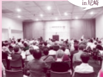
9月25日 2014年度 兵庫県高齢者大会 in 尼崎