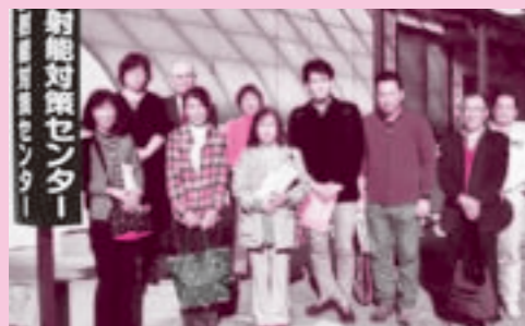
わたり病院放射能対策センターにて

福島医療生協では、医療生協わたり病院でお話をうかがいました。非常勤理事さんがスライドを使って報告。「今の福島状況をまず知ってほしい。来てくださって、それをぜひ周りの人に伝えてほしい」と。現在、原発事故による避難者は15万人。現在、空間線量は減ってきているものの、事故前の2倍はある。「放射能についてしっかり知ることが必要」と学習会を何度も行いました。放射能を理解することで、放射能に負けない免疫力をつける健康づくりや、地の野菜についても放射性物質がいかに減らせるかを知って、新鮮なものを食べて健康を維持するなどのお話も。ホールボディカウンターなど放射能測定装置も見学。引き続きバスで移動し、山間部の仮設住宅で懇談を行いました。「300人の住民のうち、200人が70歳以上」。「先が見えないのが苦しい」との声もありました。