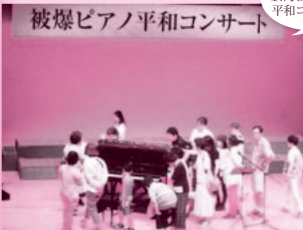
8月20日 広島被爆ピアノ 平和コンサート