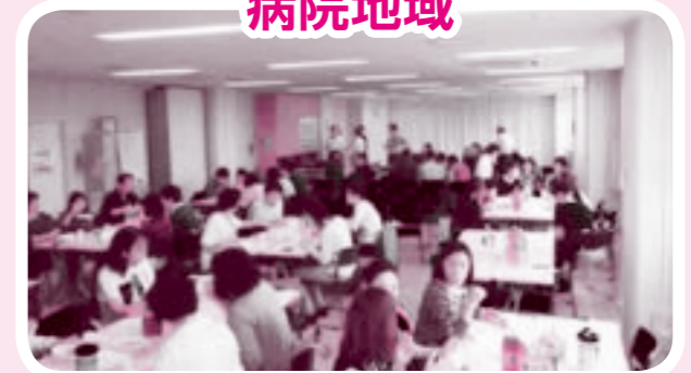
昼食の様子。各地域、参加者で「同じ釜の飯」を食べながら休憩。病院地域では手作りカレーを食べました。