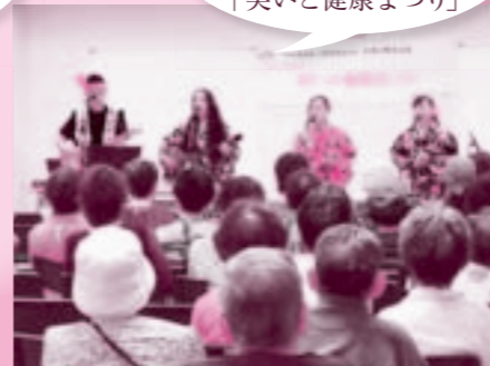
9月28日 南武西支部 合併40周年記念行事 「笑いと健康まつり」