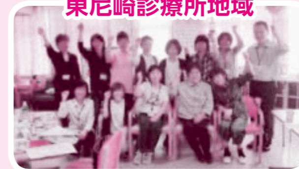
職員組合員と地域組合員が一致団結して臨みました。気合十分でセーノ行動に出発しました。