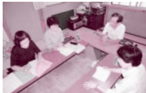
月間の話し合いをする運営委員会