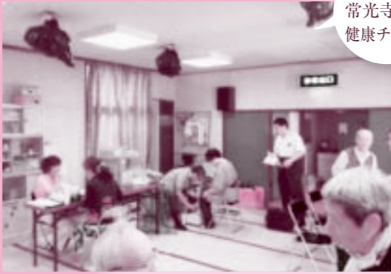
9月23日 常光寺支部 健康チェック