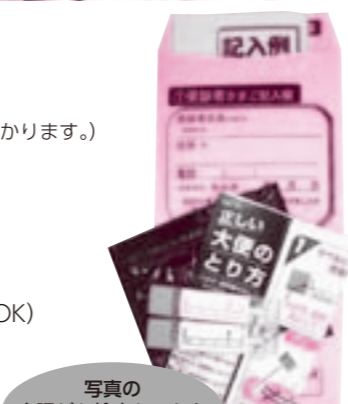
写真の大腸がん検査セットをお届けします。