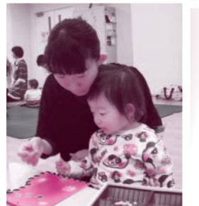
「子ども応援ひろば」のクリスマスパーティ