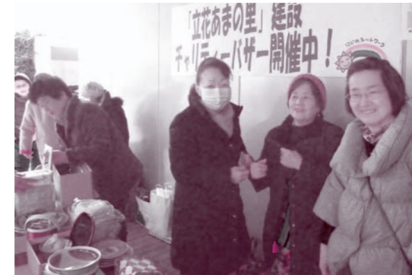
建設予定地の地元・水堂立花支部が2月17日、医療生協病院前で「立花あまの里建設チャリティーバザー」を行いました。