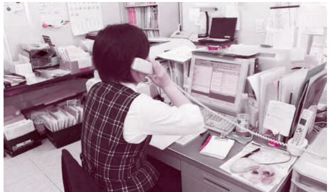
健診センターでは電話対応、予約受付など業務全般を行っています

9人のスタッフが健康診断当日のご案内担当の健診室（病院1階）と、その他業務全般を担う健診センター（別館2階）に分かれて業務に従事しています。目が回るような