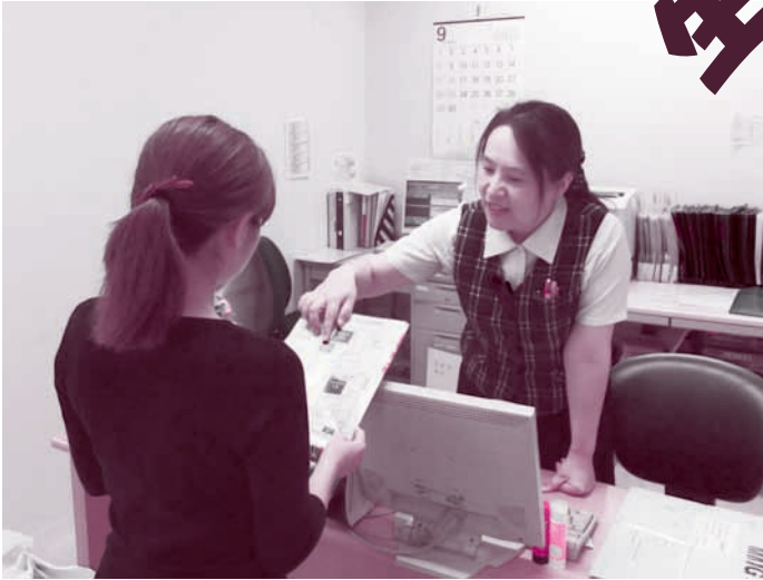
健診室で、患者さんに健診の内容・順路などを説明