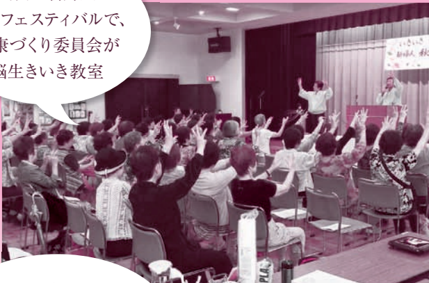
川西の新婦人 秋のフェスティバルで、 健康づくり委員会が 脳生いき教室