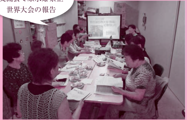
大庄北支部・班長 交流会で原水爆禁止 世界大会の報告