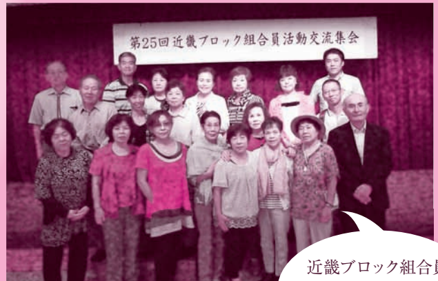
近畿ブロック組合員 活動交流集会に参 加しました