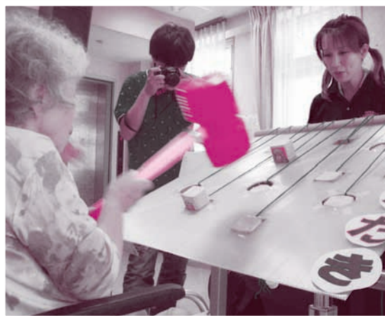
高校生手作りのもぐらたたきに、利用者さんは夢中でした

夏祭りの準備段階から関わってもらい、お手製のもぐらたたきセットや看板を高校生のみなさん自ら考えて、作成。夏休みの時間を割いて、準備から当日まで何日間も通い、一生懸命作業をしてくださいました。