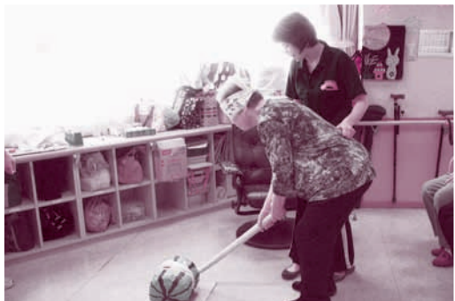
高校生が作った「スイカ」でスイカわり

利用者のみなさんも若い高校生の参加を心から喜び、昔、大工さんをしていた利用者の方は、建築関係に進学が決まっている子と話が弾み、人生のアドバイスをするなど、会話をする表情もいきいきとしていました。夏祭り当日も積極的に利用者の方々と関わり、夏祭りを盛り上げ、利用者のみなさんいつも以上にいきいきとして、笑顔がはじけていました。高校生のみなさんも、「楽しかった」と口々に話し、貴重な体験ができ、普段撮ることのないまぶしい笑顔の写真を撮ることができたと言っていました。また「声かけてくれたら、集まりますから」と、その後も定期的に授業が終わった放課後、手伝いに来てくれます。