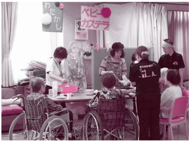
お祭りで、みなさんの笑顔が広がりました

ま。最近では、8月21日から23日の3日間、夏祭りを開催しました。夏祭りを開催するにあたって、小田高校写真部の若く爽やかな力を再び借りて、夏祭りを盛り上げてもらうと企画しました。