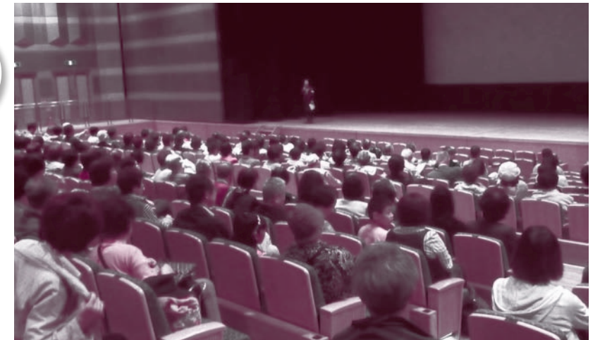
「渡されたバトン」上映会。3回の上映に1100人が集まりました

5月11日(土)、アルカイックホール・オクトにて「渡されたバトン」さよなら原発」の上映会がおこなわれました。全国で初めて、住民投票で原発建設NOを選択した新潟県巻町が舞台で、史実に基づき住民投票に至るまでのドラマを描いた映画です。尼崎医療生協は実行委員会に参加し、手作りの普及活動を進めてきました。1日・3回の公演で、入場者は合計一、一〇〇名、尼崎医療生協で普及したチケットは三八〇枚でした。 お金の魔力に打ち勝った人々に拍手を 「複雑な問題がわかりやすい物語で表現されていた」「ラストシーンでは涙が止まりませんでした」「原発はこうやって親し