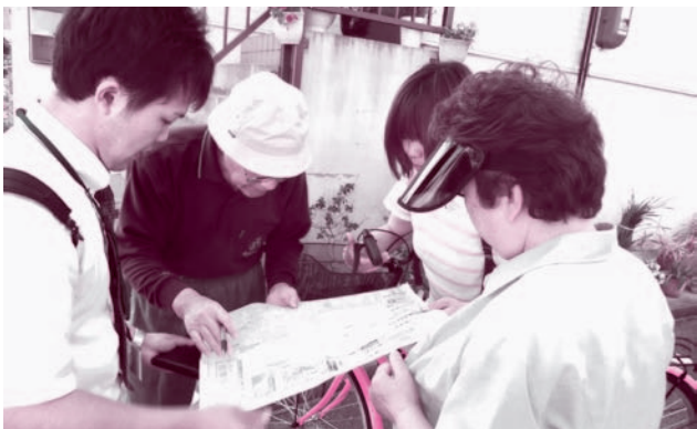
「さあ次は、どこへいこか」

日差しが強くて蒸し暑い日でした。「10部くらいでいいから、『こころづ健康』を配ってもらわれへんやろか」と一軒一軒訪問してお願います。「仕事しているから忙しくて」「からだの調子が悪くて」と、なかなか引き受けてもらえませんが、でも、「からだが一番やから気を付けてな」「最近どないしてあるんや」と声をかけ