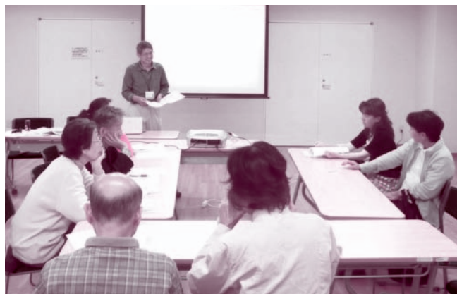
「健診結果説明会」の様子