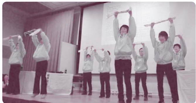
新しく考案した「タオル体操」が披露されました

「知った顔のあなただから増資するよ」の声を聴く度に、地域組合員ならではの活動だ、これからもがんばろうという気持ちになります。その普段からのつながりでアスベストなどの署名も広がっています。それが発展して武庫川駅前の署名行動を3回実施するまでになりました。地域を「ツッコ」回る大変さ・苦勞もありますが、組合員から力をもらい支えられながら支部を発展していくことが出来ました。