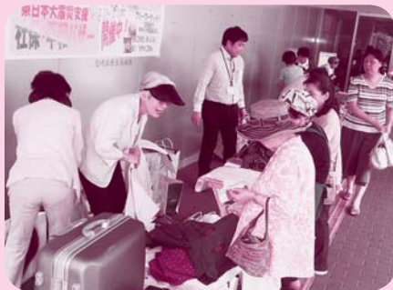
南武西支部震災支援・社保 ・平和バザー