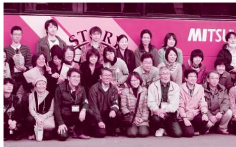
多くの方が支援に参加

から被災地への支援を開始し、今も多くの方々とともに支援活動を続けています。私たちは、「忘れてはいけない」支援の手と、応援の心を今一度広く訴えながら被災地への支援をさらに継続させるため、組合員と市民と