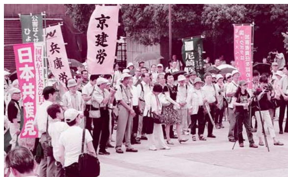
7日、判決に先立ち開かれた集會に 300人が集まりました

これが大きな力となって、神戸地裁判決で、工場の周辺住民のアスベスト被害者に対し、企業の責任を認める判決が出されました。この判決は、「我が国で初めて公害としてのクボタの法的責任を認めた」という点で、大きな意義があります。裁判所前で判決の報告を受けた人たちの中からも「がんばってよかった」の声があがりました。