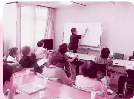
常光寺支部で 介護の学習会