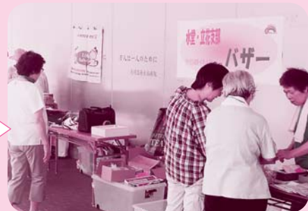
水堂・立花支部 がバザー