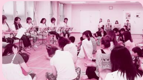
「こぶし教室」の同窓会