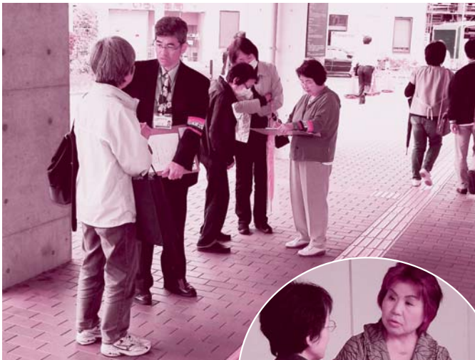
機関紙委員会のメンバー4人が、生協病院前で聞き取りをしました

今年も暑い夏がやってきます。おりしも電力不足が叫ばれる昨今、この夏をどうのりきるかは頭の痛い問題。5月15日、機関紙委員会のメンバーは、生協病院の前で、組合員からみなさんの夏をのりきる知恵について、お話をうかがいました。