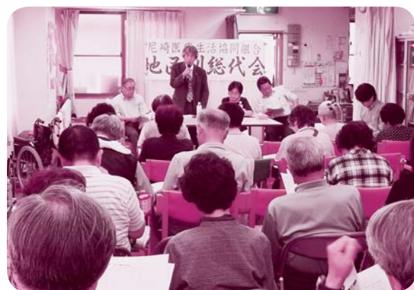
地区別総代会 本田診療所で