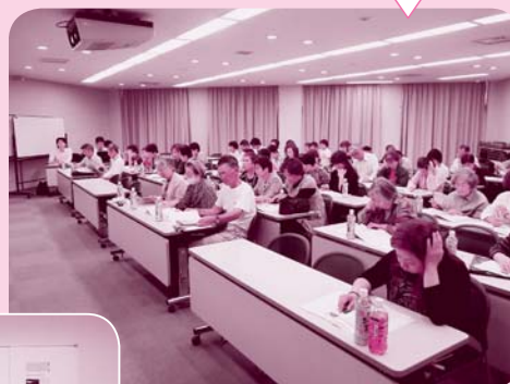
地区別総代会 女性センター レピエで