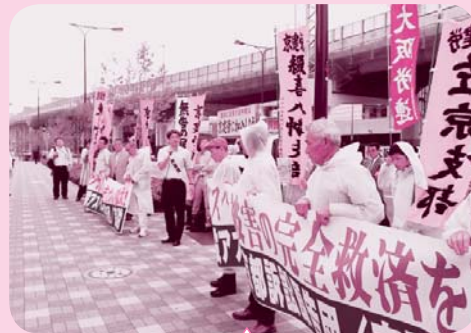
「首都圏アスベスト裁判」横浜地裁の不当判決に抗議して、クボタ本社前(大阪市内)で抗議集会