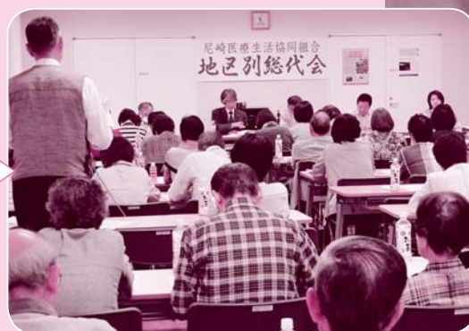
地区別総代会 組合員ひろばで