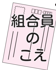
まちがいさがし 解答・通信用紙より