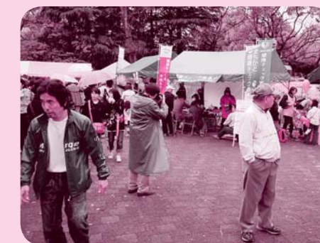
「民商元気まつり」で健康チェック