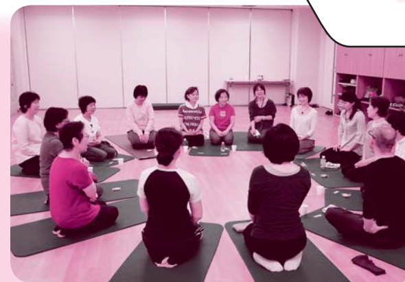
医療生協ヨーガ春の講座・最終日に交流。「見る見る元気になるのを感じた」「先生みたいなスタイルになるのを夢見てます」